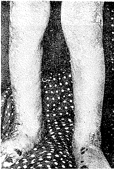
شکل ۳ ضایعات طاوولی و التیام در اندام پائین

دختر بچه ۵ ساله متولد پاریس ساکن تهران . پدر و مادر بیمار نسبت خانوادگی ندارند . در بین افراد خانواده کسی باین بیماری مبتلا نبوده است . بیماری مدت کمی پس از تولد ظاهر شده و نخست طاول از پا و قوز کپها پیدا